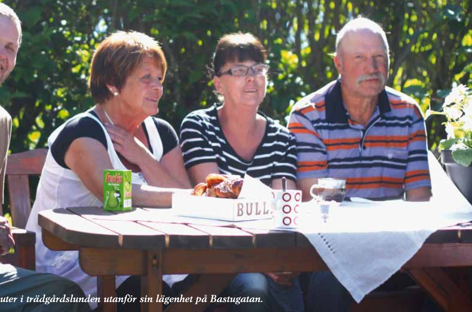
uter i trädgårdslunden utanför sin lägenhet på Bastugatan.