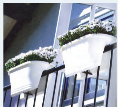
3 Corsica flower bridge ca 30 x 58, 24 cm hög 150:- inkl. moms

För beställning ring, faxa, maila eller skicka in din order.