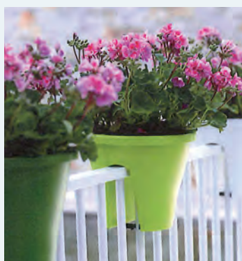
2 Corsica flower bridge 30 cm Ø, 24 cm hög 80:- inkl. moms