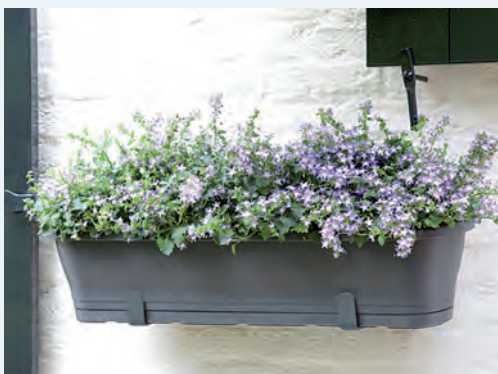
1 Corsica 2 in 1 80 x 17 cm inkl. vattensystem 225:- inkl. moms

Som hyresgäst hos Hultsfreds Bostäder kan vi erbjuda dig en smart lösning för blomlåda på balkong från elho.