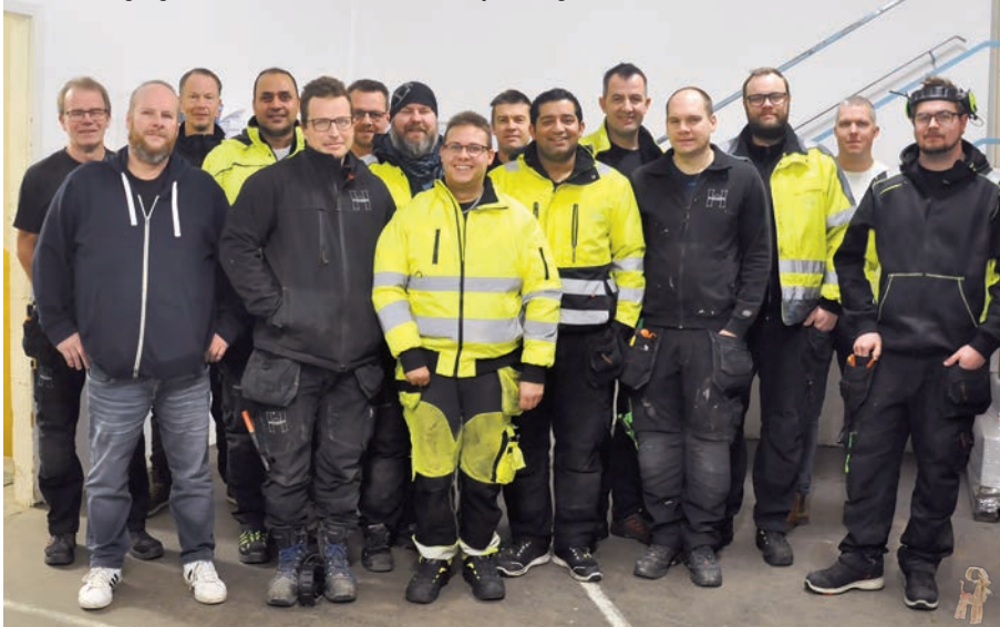
En del av gänget som i första hand arbetar med hyresfastigheter.

Däremot under jourärenden utanför kontorstid, backar alla medarbetare upp varandra på olika sätt oavsett om man brukar arbeta med kommunala fastigheter eller bostadshusen.