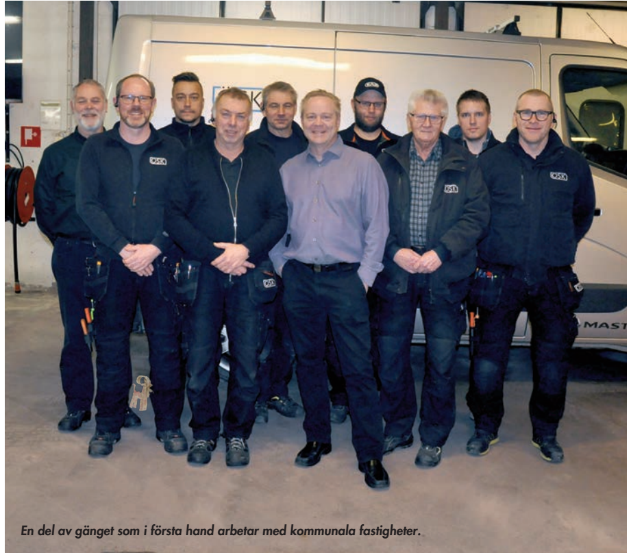
En del av gänget som i första hand arbetar med kommunala fastigheter.

Detta är anledningen till att vi alla ser framåt och har det bästa framför ögonen summerar Mikael.