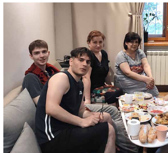
Familjen samlad i Ukraina.